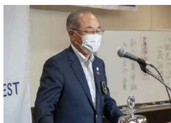
八田ガバナー講話